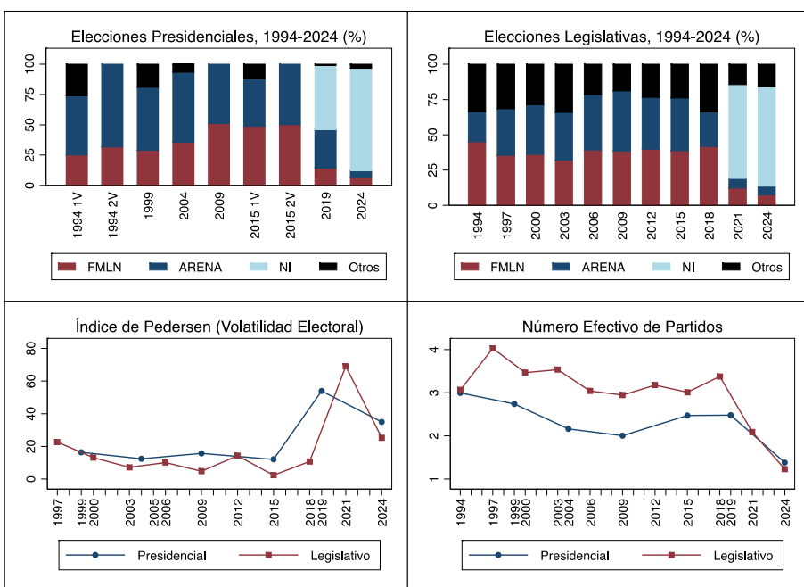
Figura 3. Indicadores seleccionados para las elecciones en El Salvador

sistema electoral para elegir a legisladores y representantes locales prácticamente sancionaron que Bukele mantendría control absoluto de país. Por su parte, los errores cometidos por la oposición —al ser incapaces de tomar distancia de su historial de corrupción y al no crear una coalición para enfrentar a Bukele— conllevaron al colapso del sistema de partidos que precedió a Bukele, tal como observadores venían advirtiendo (Pocasangre, 2021). Aquel sistema fue reemplazado por uno donde Nuevas Ideas, al mando indiscutible de Bukele, se ha consagrado como el partido hegemónico de El Salvador (ver Figura 3 y Apéndice 1).